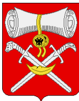
СХЕМА ТЕПЛОСНАБЖЕНИЯ МУНИЦИПАЛЬНОГО ОБРАЗОВАНИЯ «ХВАЛОВСКОЕ СЕЛЬСКОЕ ПОСЕЛЕНИЕ ВОЛХОВСКОГО МУНИЦИПАЛЬНОГО РАЙОНА ЛЕНИНГРАДСКОЙ ОБЛАСТИ»